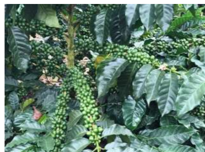
ALTA PRODUCTIVIDAD ESTABLE