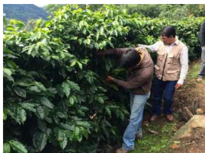
MUCHAS RAMAS AÑO A AÑO