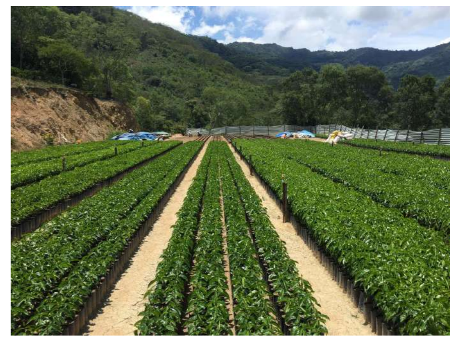
PLANTAS BIEN DESARROLLADAS