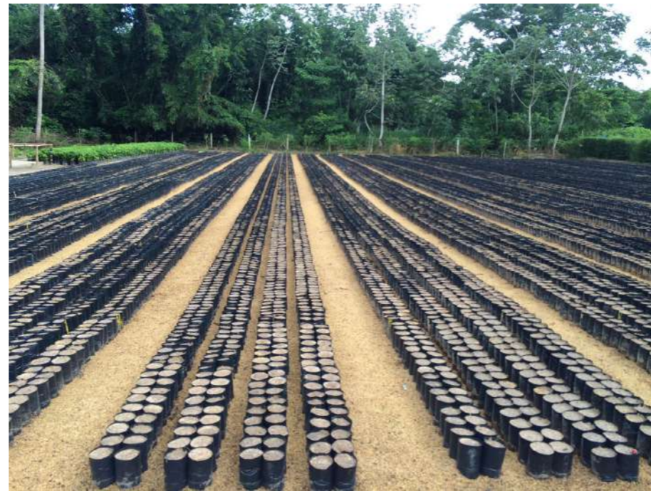
VIVEROS BIEN INSTALADOS