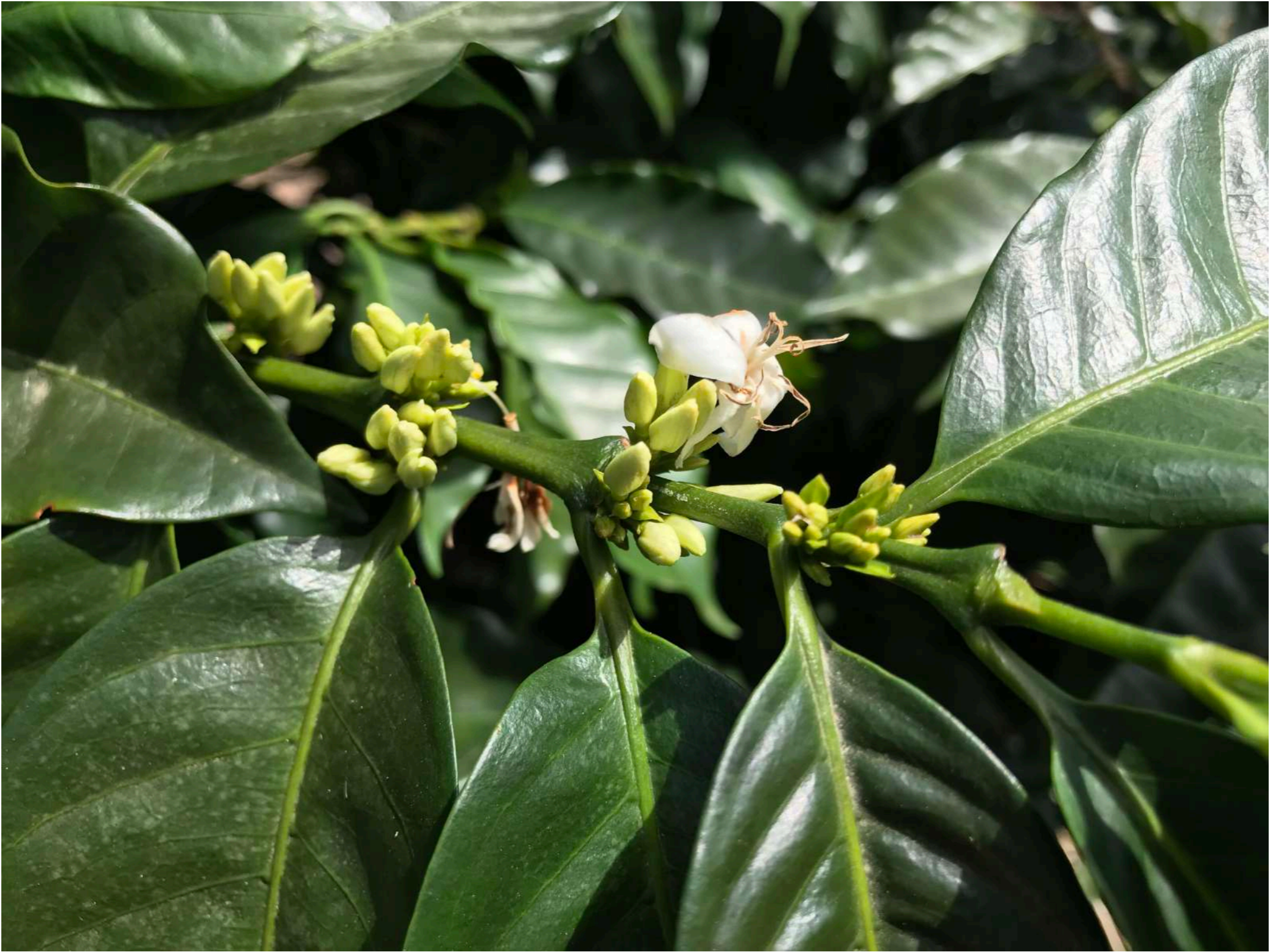
NUDOS X RAMA