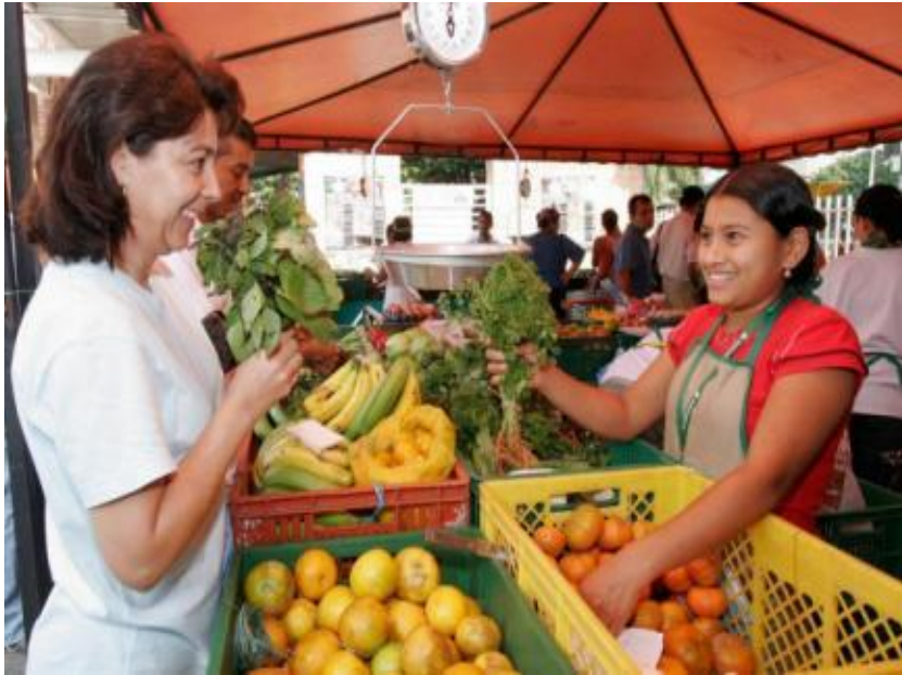
Ferias ecológicas (Lima y regiones)